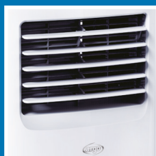
Alette regolabili in senso verticale Vertically adjustable flaps