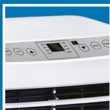
Pannello comandi digitale con display a LED Digital control panel with LED display

ARGO SWAN EVO is Argo's little one, it has excellent performance and functionality. It's handy and easy to move thanks to the multidirectional wheels and to the integrated side handles, you can easily move it from room to room, taking the cool wherever you want.