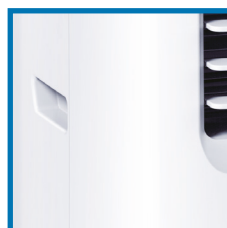
Pratiche maniglie laterali Useful side handles